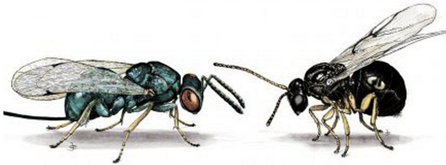
Imaxe de Torymus sinensis (esquerda) e Dryocosmus kuriphilus (dereita)

O programa de acción da Dirección Xeral de Planificación e Ordenación Forestal, para a loita biolóxica contra Dryocosmus kuriphilus , conta con dúas liñas principais de actuación: